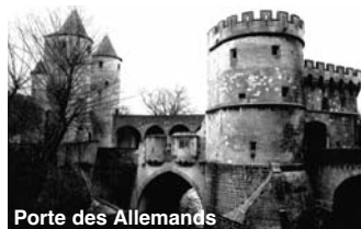
Porte des Allemands

82, rue des Allemands - 57000 Metz Tél.: 03 87 75 06 29